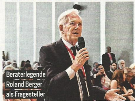
Beraterlegende Roland Berger als Fragesteller